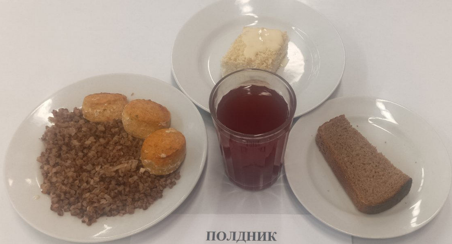
ПОЛДНИК Льготное питание 1-4 классы (7-11 лет)