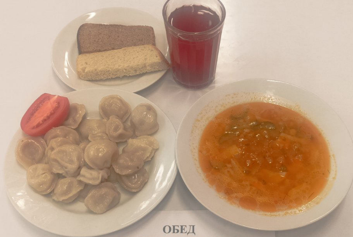
ОБЕД Льготное питание 1-4 классы (7-11 лет)