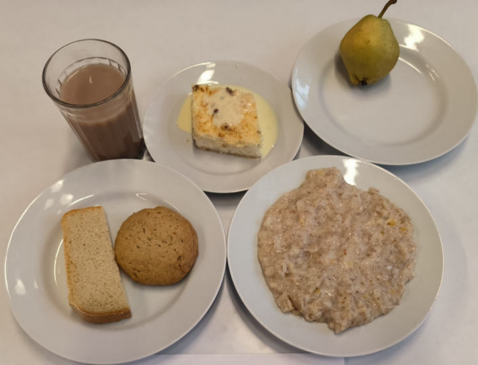
ПОЛДНИК ЛЬГОТНОЕ ПИТАНИЕ 1-4 классы (7-11 лет)