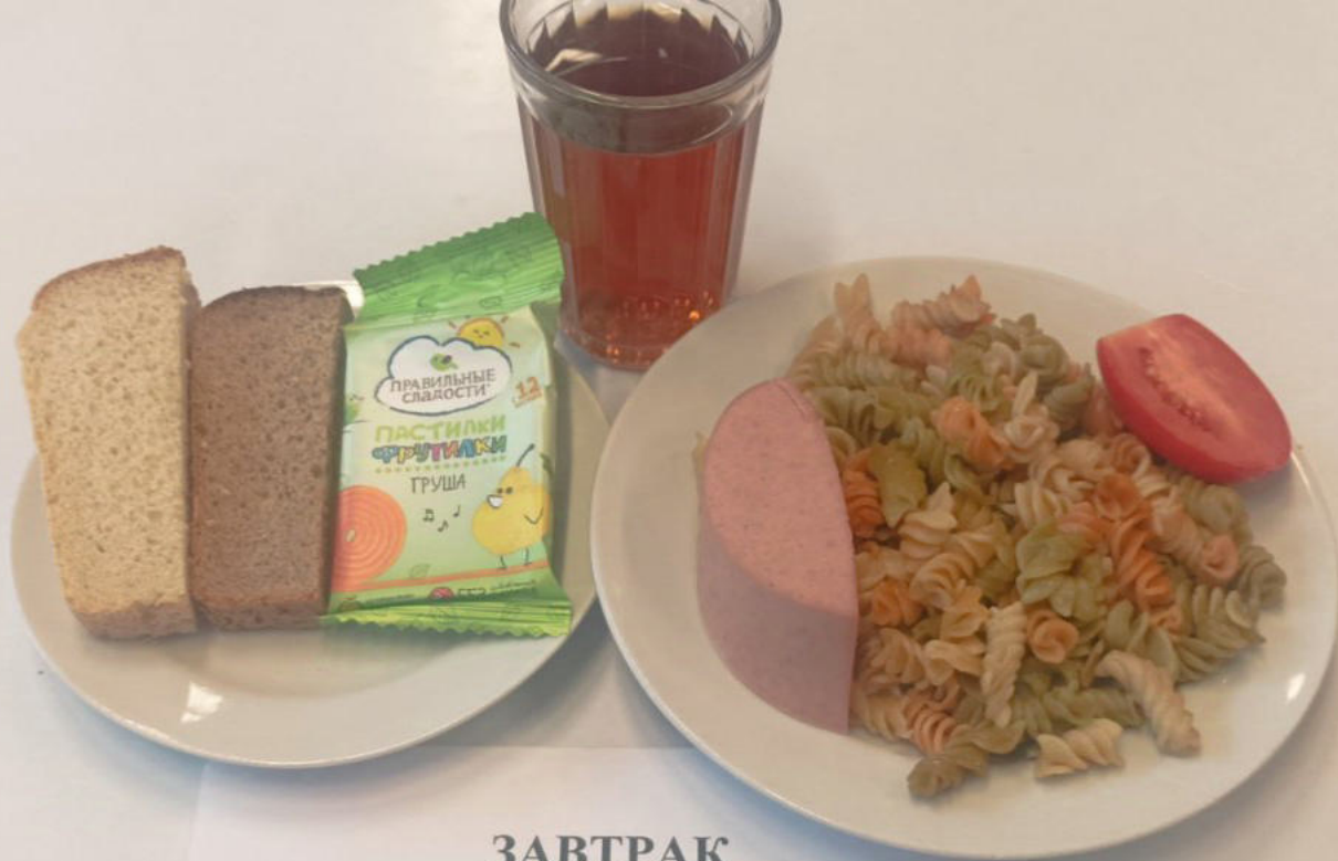
ЗАВТРАК Льготное питание 1-4 классы (7-11 лет)