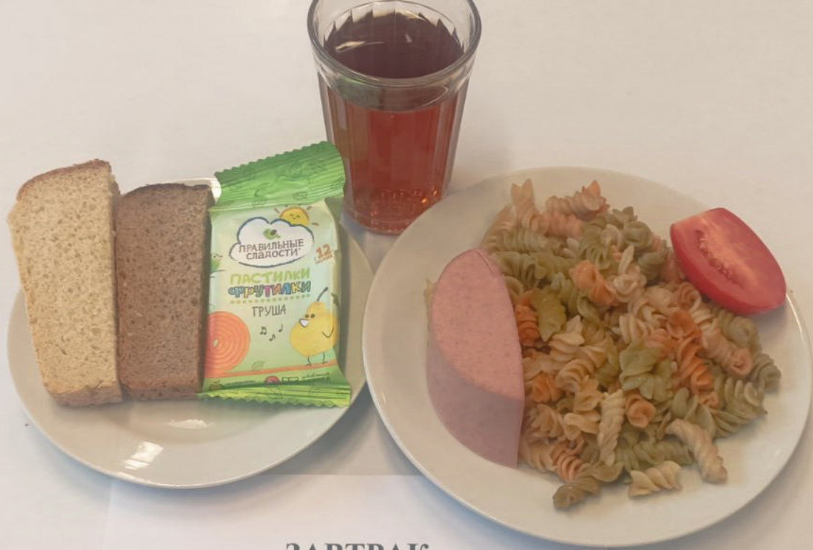
ЗАВТРАК БЕСПЛАТНОЕ ПИТАНИЕ 1-4 классы (7-11 лет)