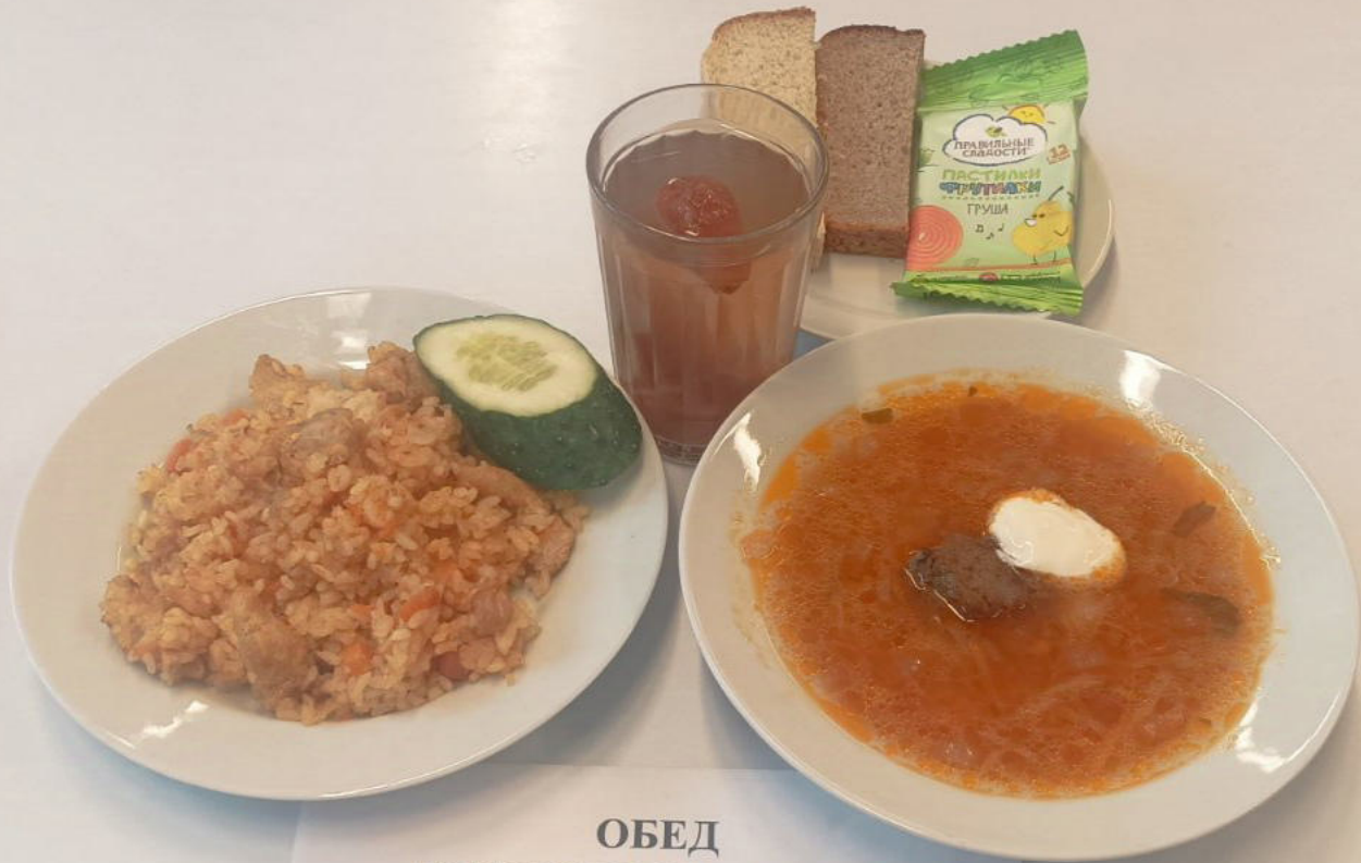
ОБЕД ЛЬГОТНОЕ ПИТАНИЕ 1-4 классы (7-11 лет)