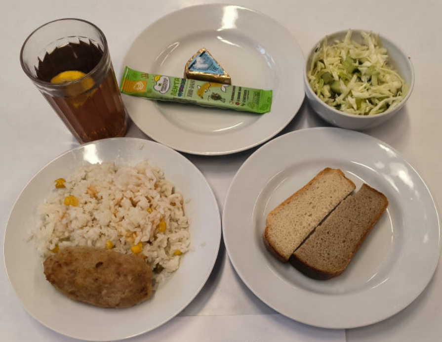
ЗАВТРАК ЛЬГОТНОЕ ПИТАНИЕ 1-4 классы (7-11 лет)