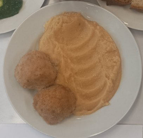
ЗАВТРАК Льготное питание 1-4 классы (7-11 лет)