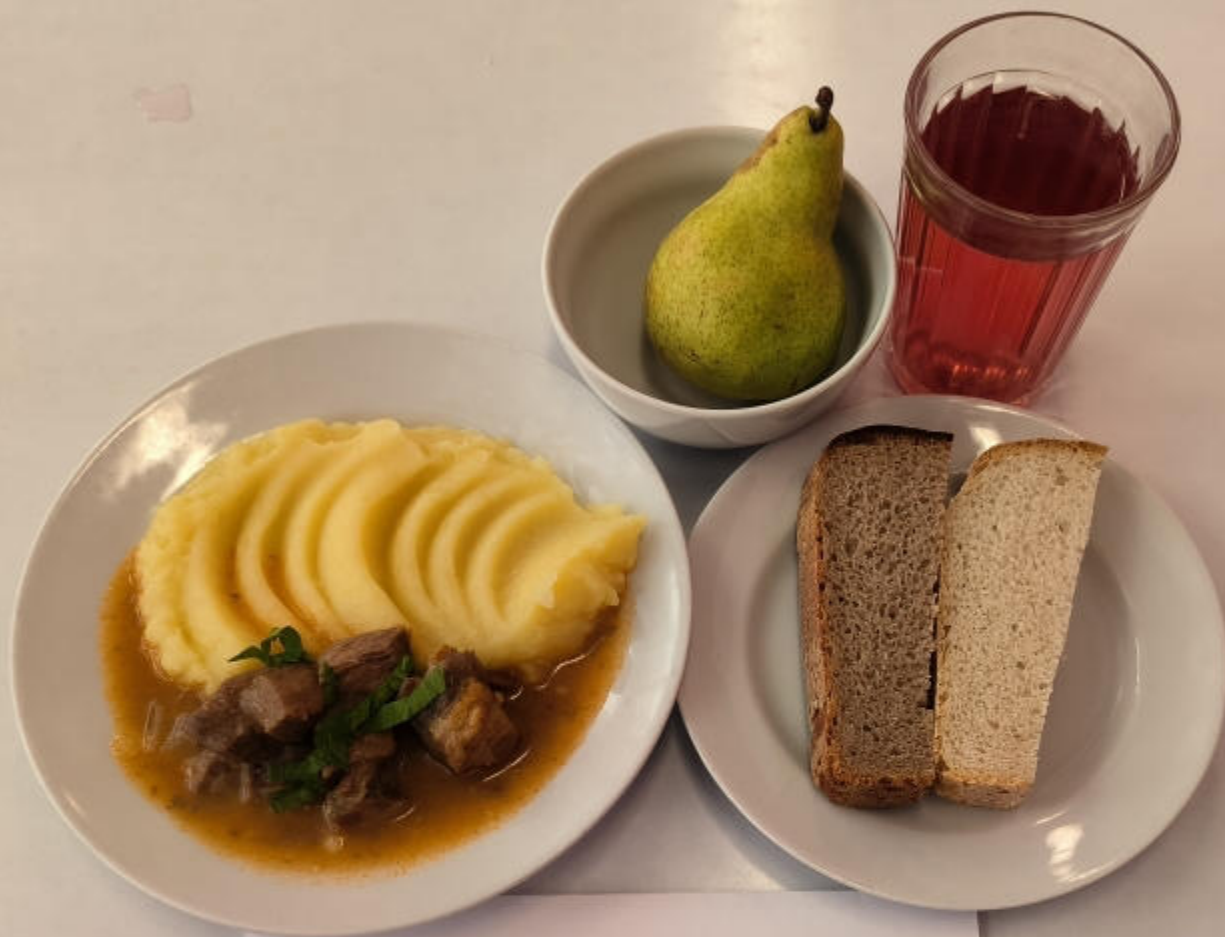
ЗАВТРАК Льготное питание 1-4 классы (7-11 лет)