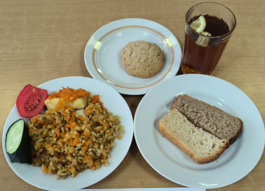
ЗАВТРАК ЛЬГОТНОЕ ПИТАНИЕ 1-4 классы (7-11 лет)