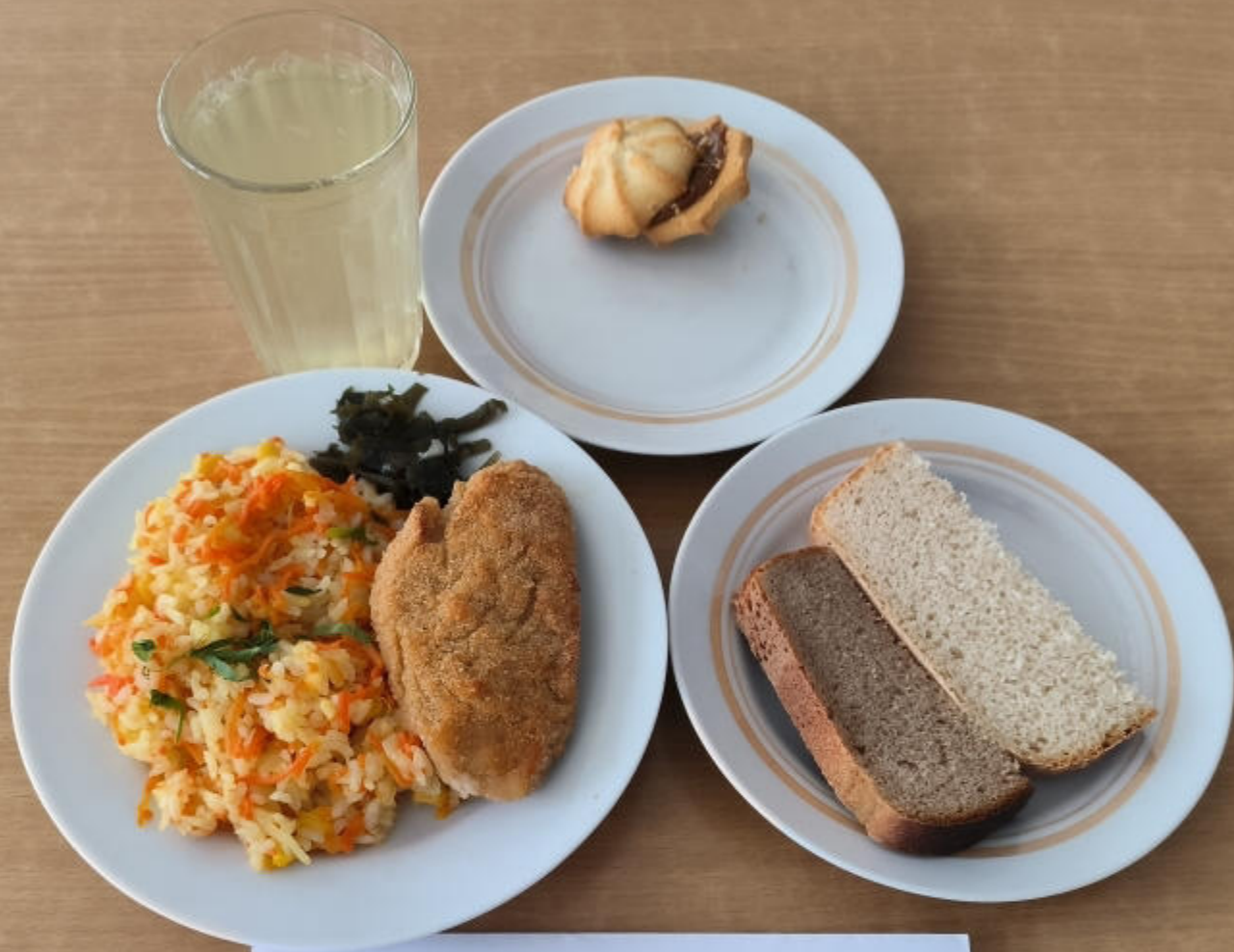
ЗАВТРАК ЛЬГОТНОЕ ПИТАНИЕ 1-4 классы (7-11 лет)